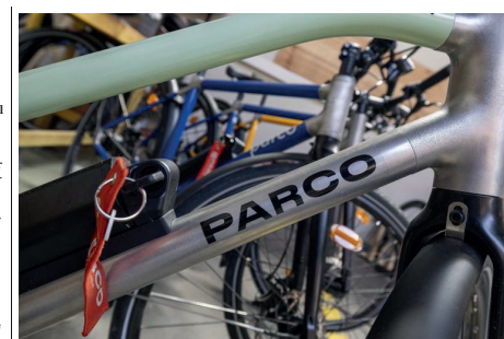
Parco Cycles a été lauréate de l'appel à projets du dispositif France 2030, ce qui lui permet d'avoir un soutien financier pour accompagner le développement de l'entreprise.

Puis, le reste des pièces commandées (issus d'une petite dizaine de pays dont la Chine, Taiwan, et d'autres pays européens) sont assemblés sur le cadre. Sur