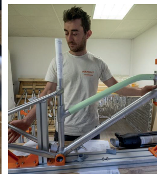
Toutes les composantes du nouveau vélo ont été repensées.

« Il a fallu qu'on reparte de zéro en faisant exactement l'inverse de notre stratégie de départ »