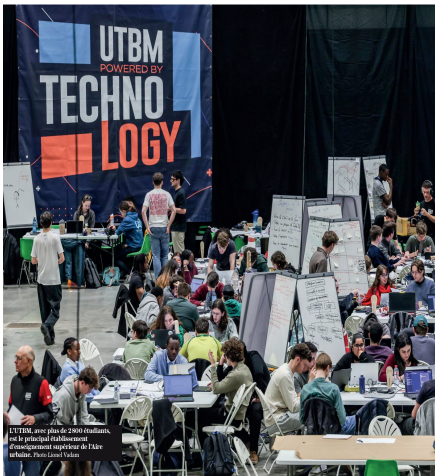
L'UTBM, avec plus de 2800 étudiants, est le principal établissement d'enseignement supérieur de l'Aire urbaine.