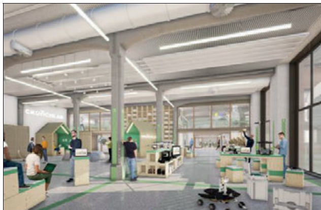
Les travaux, estimés à plus de 5 millions d'euros devraient débuter en avril prochain. Document DeA Architectes