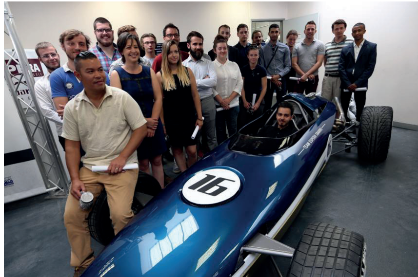
La promotion prête à s'aventurer sur les routes d'un premier emploi. Ici, avec « Rush »

euros : c'est le coût, pour les étudiants, de cette année unique de formation. Ils peuvent néanmoins bénéficier d'aides.