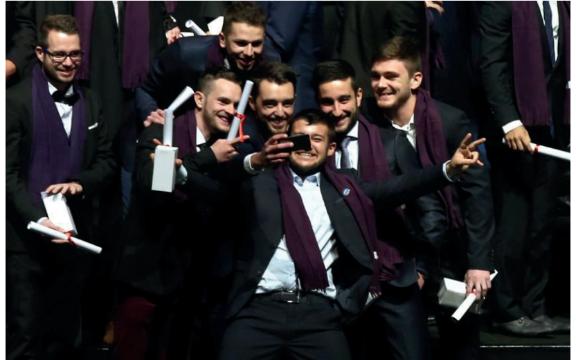
Simultanément samedi, 1 500 ingénieurs ont reçu leurs diplômes dans les universités technologiques de Belfort Montbéliard, Compiègne et Troyes.

■ Où travaillent les ingés formés dans l'Aire urbaine ? 22,5 % trouvent leur premier emploi à l'étranger. En Suisse, en Allemagne, en Chine, au Brésil et ailleurs. 17 % demeurent en Franche-Comté. C'est également la proportion d'étudiants comtois qui intègre l'UTBM où se côtoie une vingtaine de natio-