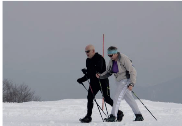
Avec ou sans raquettes, le massif du Ballon d'Alsace est le paradis des randonneurs.