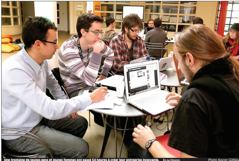
Une trentaine de jeunes gens et jeunes femmes ont passé 54 heures à créer leur entreprise innovante. En 24 Heures