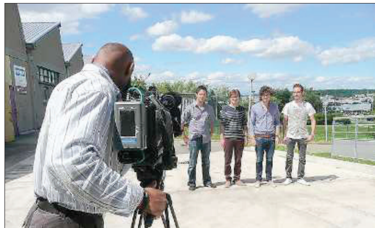
Les quatre finalistes sur près de 200 candidats tournent depuis hier devant les caméras de l'émission Turbo au lycée Viette.

Les caméras de l'émission Turbo sont braquées depuis hier sur le lycée Viette pour enregistrer un jeu concours qui sera diffusé sur M6 et qui permettra au meilleur des quatre finalistes, de gagner une année de formation à l'école Espera Sbarro.