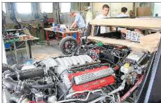
Sous le capot, un moteur V8 Maserati. Une petite bombe.

■ Y ALLER Présentation et démonstration des prototypes, aujourd'hui de 14 h 30 à 17 h, parking PO de l'Axone à Montbéliard.