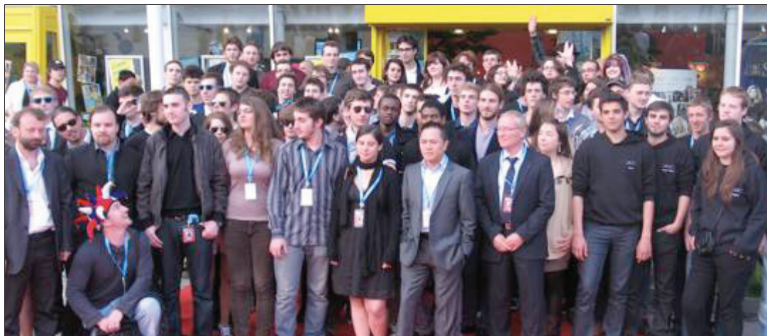
Le jury de l'édition 2012 du Festival du film d'un jour et les dix équipes participantes.