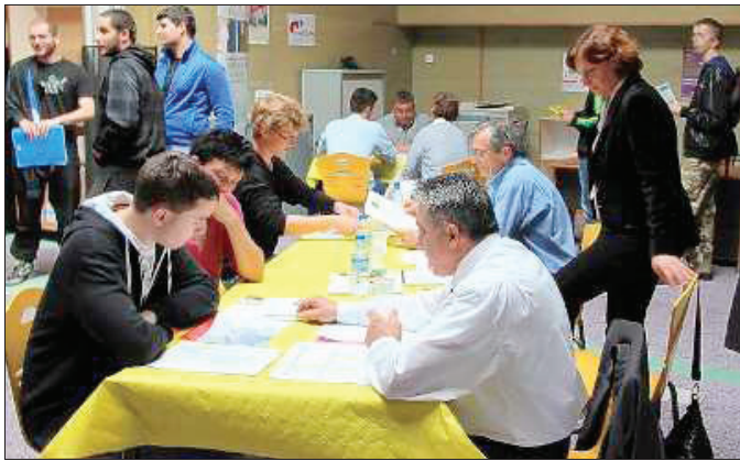
Les entretiens entre jeunes et les représentants des entreprises se sont suivis hier tout au long de l'après-midi au CFAI d'Exincourt.