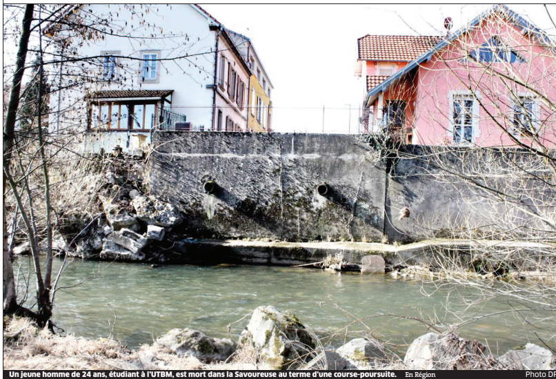
Un jeune homme de 24 ans, étudiant à l'UTBM, est mort dans la Savoureuse au terme d'une course-poursuite. En Région Photo DP