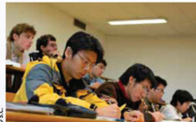
L'université de Franche-Comté incite les étudiants à la rencontre, d'où qu'ils viennent.

Le cinquième forum Oser l'international, organisé par l'université de Franche-Comté, confronte étudiants et professionnels en mesure de favoriser les stages à l'étranger.