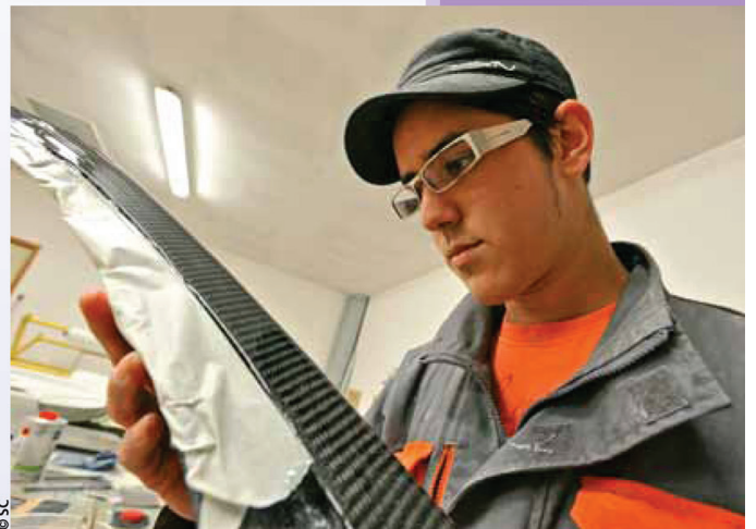
L'école Sbarro fait sa rentrée cette année au Lycée viette.