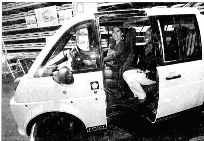
■ La Mia séduit par sa taille, son style, son autonomie et son prix.

Toujours au rayon des technologies d'avenir, la société mulhousienne MoveCoach présente un projet soutenu par le pôle véhicule