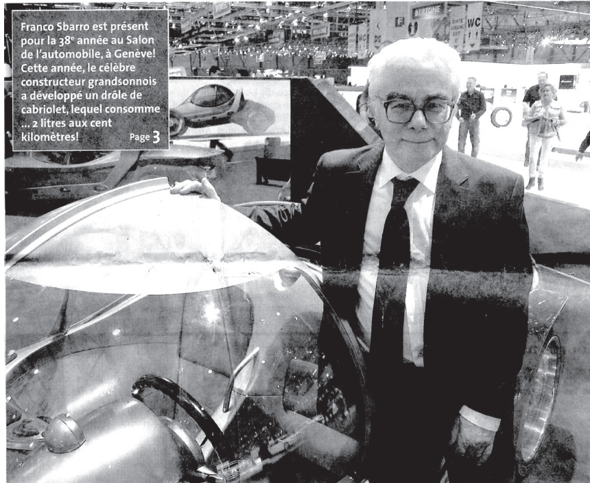
Franco Sbarro est présent pour la 38 e année au Salon de l'automobile, à Genève! Cette année, le célèbre constructeur grandsonnois a développé un drôle de cabriolet, lequel consomme... 2 litres aux cent kilomètres! Page 3