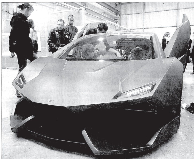
Derniers préparatifs en atelier pour le concept-car Evoluzione dans les ateliers de Technoland.

« Être présent au salon de Genève est une récompense pour eux. Ils auront l'occasion d'expliquer au public leur projet tout en s'investissant dans la relationnel et la communication », explique Pierre Guene-